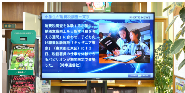
時事通信社のニュース画面

店頭でキャンペーンを告知する際、以前は紙のポスターを掲示するだけだったのですが、導入後は情報をPowerPoint®で編集し、店頭のディスプレイでも配信しています。PowerPoint®でアニメーションを加えて作成したものが、そのまま配信できるのは非常に便利です。専門的な環境がなくても使いやすいように、良く考えられたシステムだと思います。また無料で使用できるテンプレートが充実しているのもありがたいです。年金受給日や月末は窓口が特に混雑するのですが、キャンペーン情報の間に、暮らしに役立つ情報を発信することで、待ち時間の負担緩和に努めています。