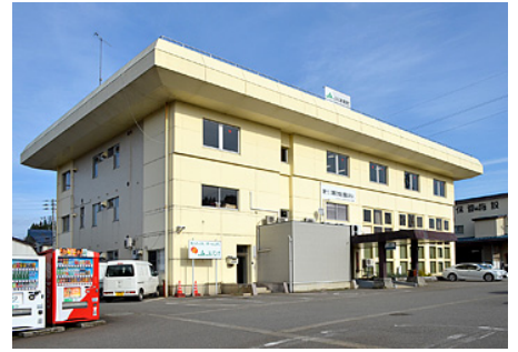
JA津南町本店。地域一帯に様々な事業拠点が点在。