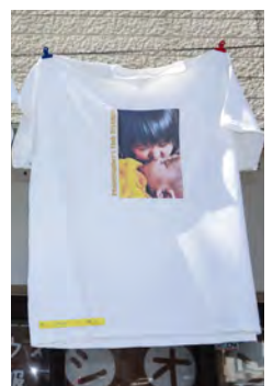
お孫さんを撮影したこの写真が優秀作品に選ばれました。

「この自社でのイベント活用の実践事例を紹介し、他のお客様へのRICOH Ri 100の販売も推進していきたい」とビジネスの拡大も視野にいれていた。