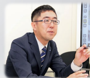
味の素エンジニアリング株式会社 MR事業部関東支店長

PC会議や画面共有だけでは不十分。 遠隔地にいる相手とも手軽に詳細な議論が できる方法を探していました。