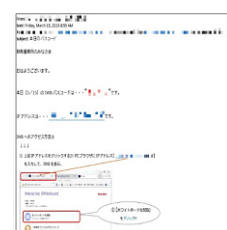
毎朝IWBを起動するとともにパスコードをメールで配信し、誰でもすぐ使えるようにしている。