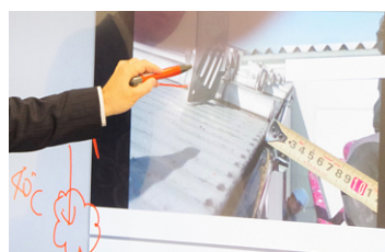
“この辺り・これ・この位置・もう少し下”というニュアンスも、画面に書き込めば一目瞭然。遠隔地とも簡単に共有できる。