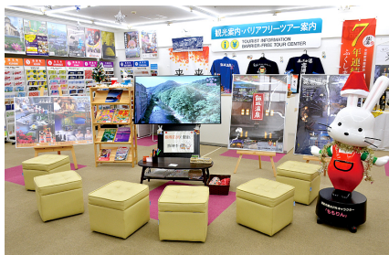
案内所中央のモニター。ゆっくり見ていただけるよう椅子を用意しています。