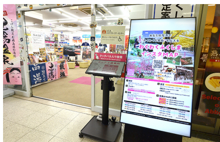
大型モニターをアイキャッチとして活用し、案内所内へ誘導する流れをつくっています。