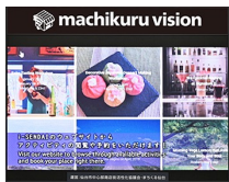
和英併記の観光案内