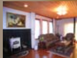
ワイドコンバージョンレンズ装着での画角