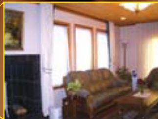
一般的なデジタルカメラの画角での撮影 (35mm)