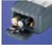
単三乾電池 (アルカリニッケル ® ニッケル水素電池 ® ) ※オプション