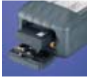
リチウムイオン電池*